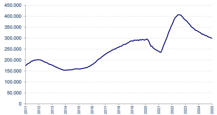
Aantal ontvangen vacatures in de laatste 12 maanden

Voor elke maand wordt het aantal in de voorbije twaalf maanden ontvangen vacatures getoond. De seizoensinvloeden zijn in deze grafiek niet zichtbaar en de trend is duidelijker.