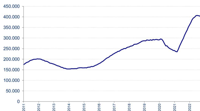
Aantal ontvangen vacatures in de laatste 12 maanden

Voor elke maand wordt het aantal in de voorbije twaalf maanden ontvangen vacatures getoond. De seizoensinvloeden zijn in deze grafiek niet zichtbaar en de trend is duidelijker.